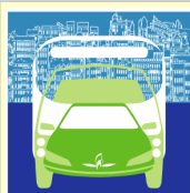
SITE PILOTE Gaz Naturel Véhicules