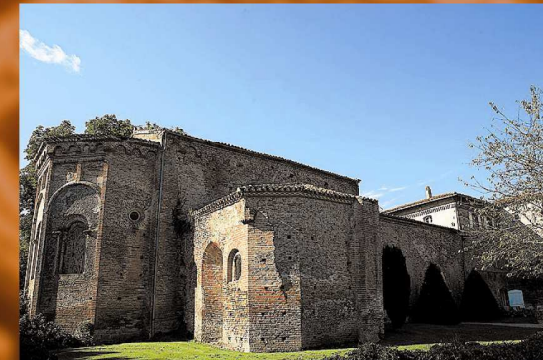
Eglises romanes du Couserans