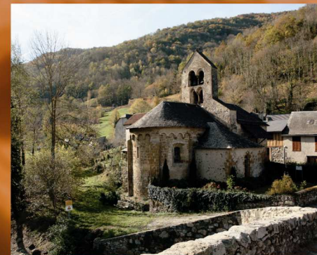
Eglise Saint-Pierre d'Ourjout