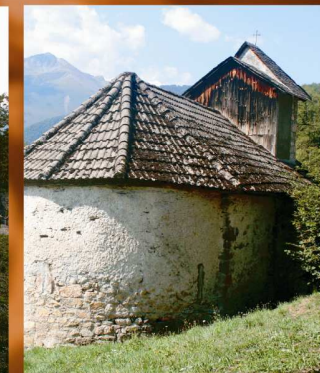
Eglise Saint-Michel d'Irazein